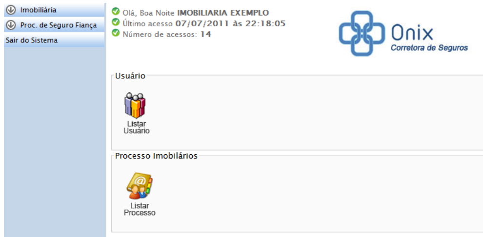
Figura 3 - Home do SINC

Após acessar o SINC, a seguinte tela será exibida: